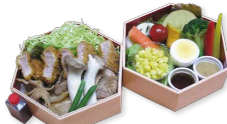
A007 特選ヒレカツ、生姜焼きコンビ重 1,960円(税込)

選び抜かれた柔らかい国産豚ヒレ肉を高温でさっと揚げ、カリッ!ジュー!と旨みいっぱい。美味しい旬の温ベジタブルとのバランスが最高です。 W14.5XD14.5XH10.0 (cm)