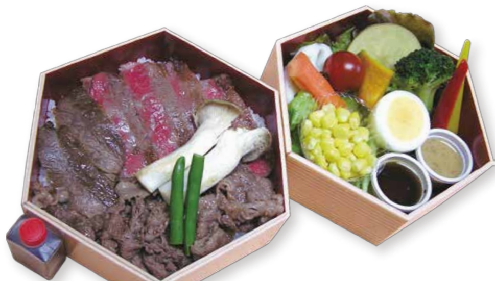
A001 A5ザブトン焼肉重 2,160円(税込)

当店自慢のお肉料理のお弁当と温ベジタブルを二段重ねにした 見た目にもお得感抜群のお料理弁当です。