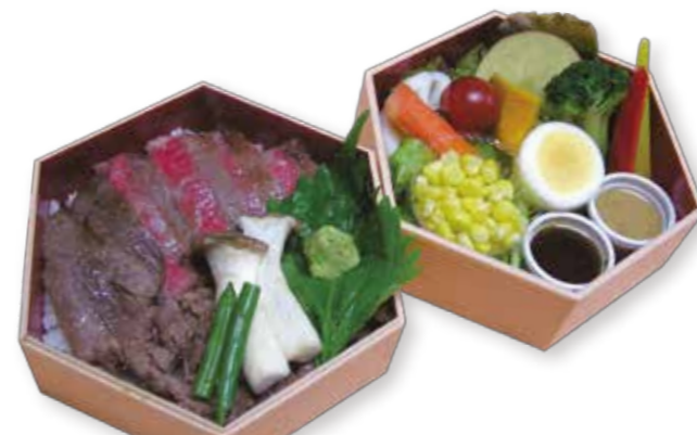
A003 A5ザブトン塩わさび重 2,160円(税込)

「もっともっとA5ザブトンを食べたい」のご要望にお応えしたお得な新メニューです。 美味しい旬の温ベジタブルとのバランスが最高です。 W14.5XD14.5XH10.0 (cm)