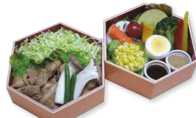
A008 特選生姜焼き重 1,620円(税込)

国産豚ヒレカツとロース肉の生姜焼きのコンビはボリューム満天です。美味しい旬の温ベジタブルとのバランスが最高です。 W14.5XD14.5XH10.0 (cm)