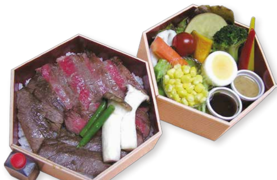
A002 A5ザブトン焼肉重デラックス 2,840円(税込)

黒毛和牛A5ザブトンと霜降りスライス肉を秘伝のたれで絡めて、丁寧に焼き上げた当店一番人気メニューです。 美味しい旬の温ベジタブルとのバランスが最高です。 W14.5XD14.5XH10.0 (cm)