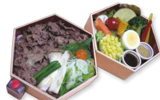
A004 黒毛和牛焼きしゃぶ重 2,160円(税込)

黒毛和牛A5ザブトンをさっぱりわさび風味と塩味で、ザブトンならではの食感と旨みがたまりません。美味しい旬の温ベジタブルとのバランスが最高です。 W14.5XD14.5XH10.0 (cm)