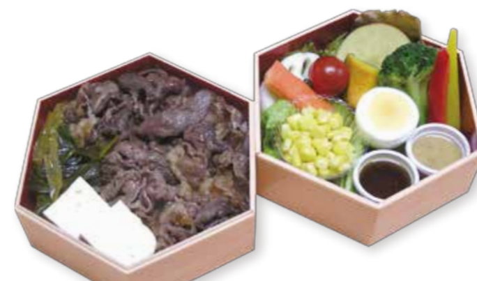
A005 黒毛和牛すき焼き重 2,160円(税込)

黒毛和牛の余計な脂を焼き落とし、焼きしゃぶ風に仕上げました。さっぱりとポン酢でヘルシーにお召上がりください。美味しい旬の温ベジタブルとのバランスが最高です。 W14.5XD14.5XH10.0 (cm)