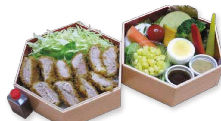
A006 特選ヒレカツ重 1,960円(税込)

黒毛和牛の霜降りスライス肉を当店自慢の秘伝のタレですき焼風に味付けした逸品です。美味しい旬の温ベジタブルとのバランスが最高です。 W14.5XD14.5XH10.0 (cm)